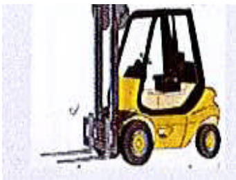
Catégorie 3 Chariots élévateurs en porte à faux Inférieure ou égale à 6 T