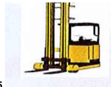
Catégorie 5 Chariots élévateurs à mât rétractable