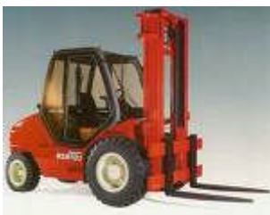
Catégorie 4 Chariots élévateurs en porte à faux De capacité supérieure à 6 T