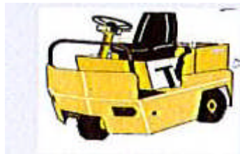
Catégorie 2 Chariots tracteurs et Plateau porteur de capacité inférieure à < 6 T